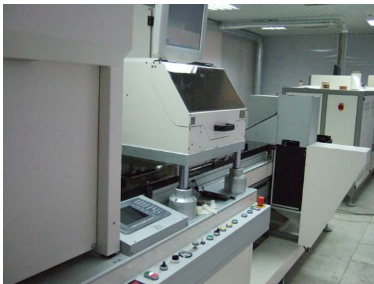
Оборудование фирмы «КЕКО» для изготовления тонких пьезокерамических пленок