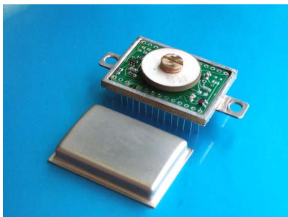
Высокочувствительный датчик угловых скоростей

Разработка датчиков контроля уровня топлива нового поколения для Министерства транспорта РФ.